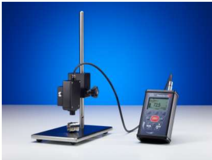
德国 SITA 表面清洁度仪

通过对手机触摸屏清洁度的测试，可以量化测出清洗后的干净程度。也可以通过更改清洗剂配方、改变清洗温度、使用超声波等方法，得知这些清洗工艺优化方法对提高清洗效果的影响程度，为提高清洗稳定性和清洗效率提供精确数据。