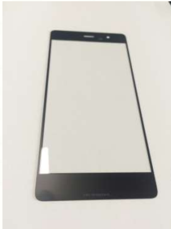
样品 2：已清洗干净的样品