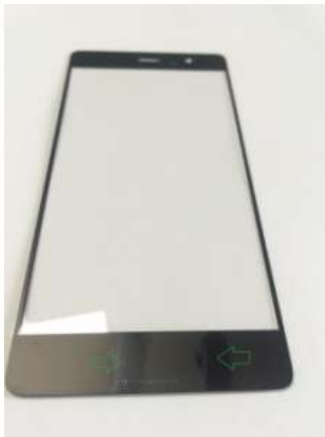
样品 1：绿色箭头所指的位置有丙烯酸树脂污染

下面是 2 个手机玻璃样品，边框表面已有丝印油墨。用德国 SITA 清洁度仪测试边框部位，只需要十几秒即可得出数据。读数越高表示污染越严重，单位为 RFU，即相对荧光单位。